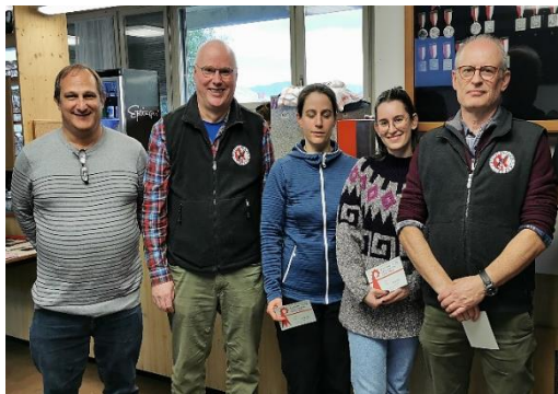
25m Rang 2 Sissach 1822