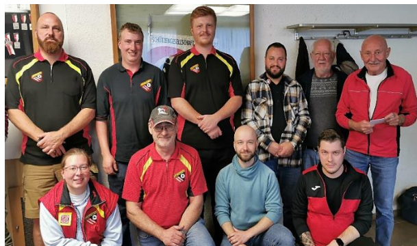
links: Sieger Zunzgen Tenniken 1 mit Oberdorf auf Rang 3